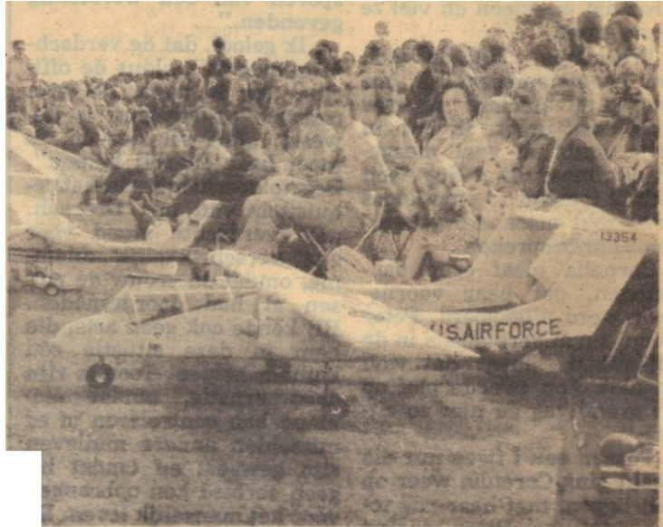
Ongelooflijk mooie radiografisch bestuurbare modelvliegtuigen zullen op de show in Hulsens hun opwachting maken.

Zo zullen er model-helikopters door het luchtruim zweven, maar ook dubbeldekkers en modellen die maar even een snelheid kunnen ontwikkelen van tegen de 300 km per uur. Er wordt een demonstratie formatievliegen gegeven en er zullen enkele meermotorige model-